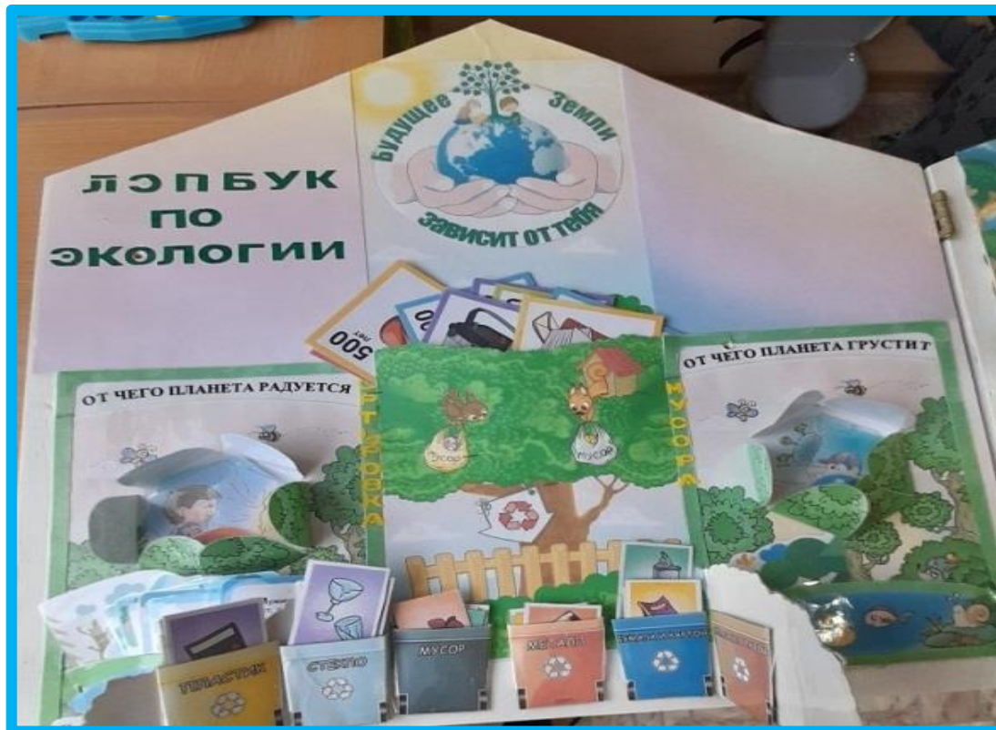
Макет № 1 «Будущее планеты зависит от тебя»

Приложение А. Фотоотчет о применении в работе с детьми лэпбука по экологии